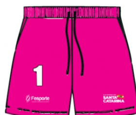
CALÇÃO DE JOGO FEMININO