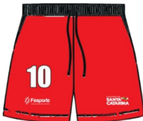
CALÇÃO DE JOGO MASCULINO