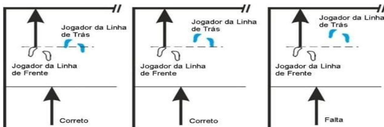
Exemplo B: Determinação das posições entre Jogadores da mesma linha

Cada jogador à direita ou esquerda das linhas de frente e de trás deve ter ao menos parte de seu pé mais próximo da linha lateral direita ou esquerda que os pés do jogador central naquela linha, como seguem nas figuras: